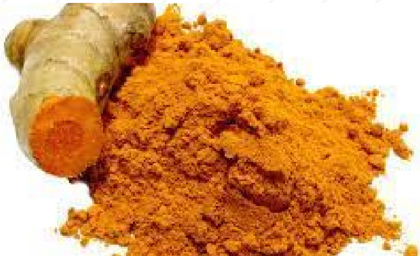
Kurkumin från gurkmeja